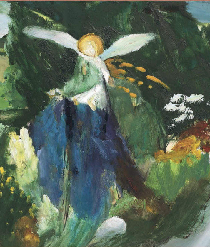
Verkündigungengel (Detail), 2014. Mt./ Lw. 140 x 150 cm

1947 geboren in Limbach/ Sachsen 1966–69 Studium der Sozialpsychologie an der Friedrich-Schiller-Universität Jena 1969–74 HGB Leipzig bei Tübke und Kuhrt 1974–77 Meisterschülerstipendium in Berlin ab 1977 freischaffender Maler 1978 Preis Junge Kunst 2014 stirbt auf einem Acker nahe Netzeband www.thomasziegler-archiv.com